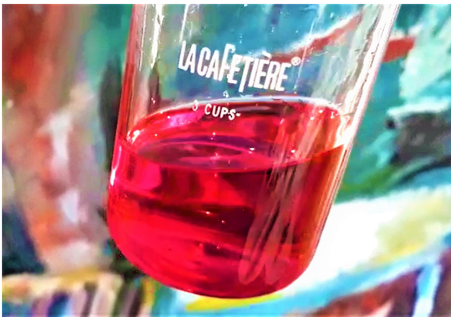
Die Heizkosten senken mit dem Hochleistungswärmeträger LMP – R1 Heizungsblut

Umseitig finden Sie eine Möglichkeit Co 2 - / und Brennstoff zu reduzieren und damit bis zu -27% Ihrer Heizkosten zu senken. Die Heiztechniken werden grundlegend optimiert. Wenn LMP-R1 im Heizungskreislauf 20 Jahre zirkuliert, fahren Sie zwangsläufig, bei gleichen Raumtemperaturen, hohe Renditen ein. 1,3 Mill. Liter zirkulieren bereits europaweit in Gas- und Ölheizungen, BHKW, Wärmepumpen, Solar- und Kühlanlagen. Dieser Hochleistungswärmeträger hat sich bewährt.